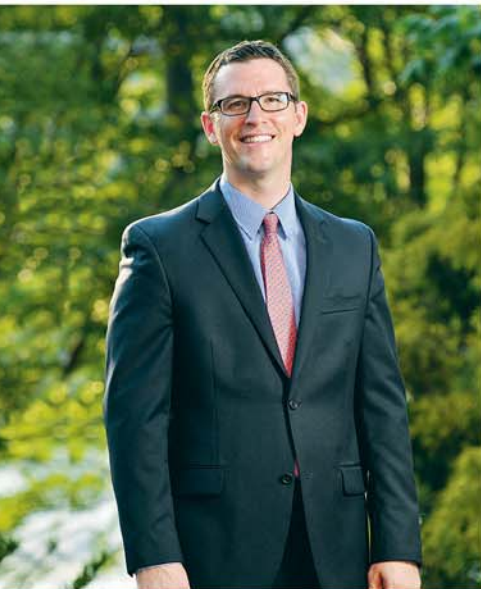
PAR BRIAN HEWITT