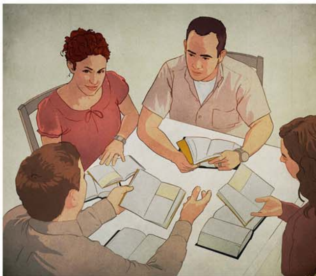
L'étude de la Bible a aidé de nombreux hommes à changer.