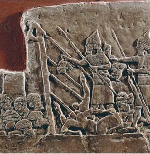
RELIEF MURAL REPRÉSENTANT DES SOLDATS QUI ENTASSENT LES TÊTES DE LEURS PRISONNIERS.

Archibald Henry Sayce, spécialiste de l'Assyrie, décrit les barbares qui suivaient la prise d'une ville : « Partout où le conquérant passait, il laissait des pyramides de têtes humaines. Les garçons et les filles étaient brûlés vifs, à moins qu'on leur réserve un sort encore pire ; les hommes étaient empalés, écorchés vifs ou aveuglés ; sinon, on leur coupait les mains et les pieds, les oreilles et le nez. » ■