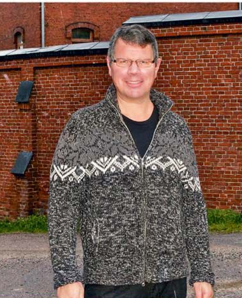
PAR ESA LEINONEN