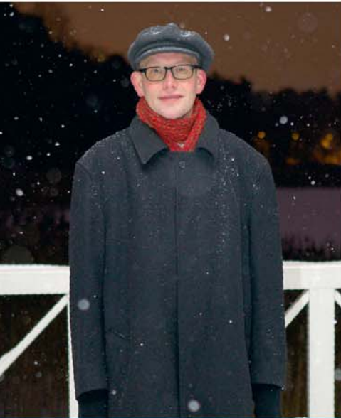
PAR JUKKA SYLGRÉN