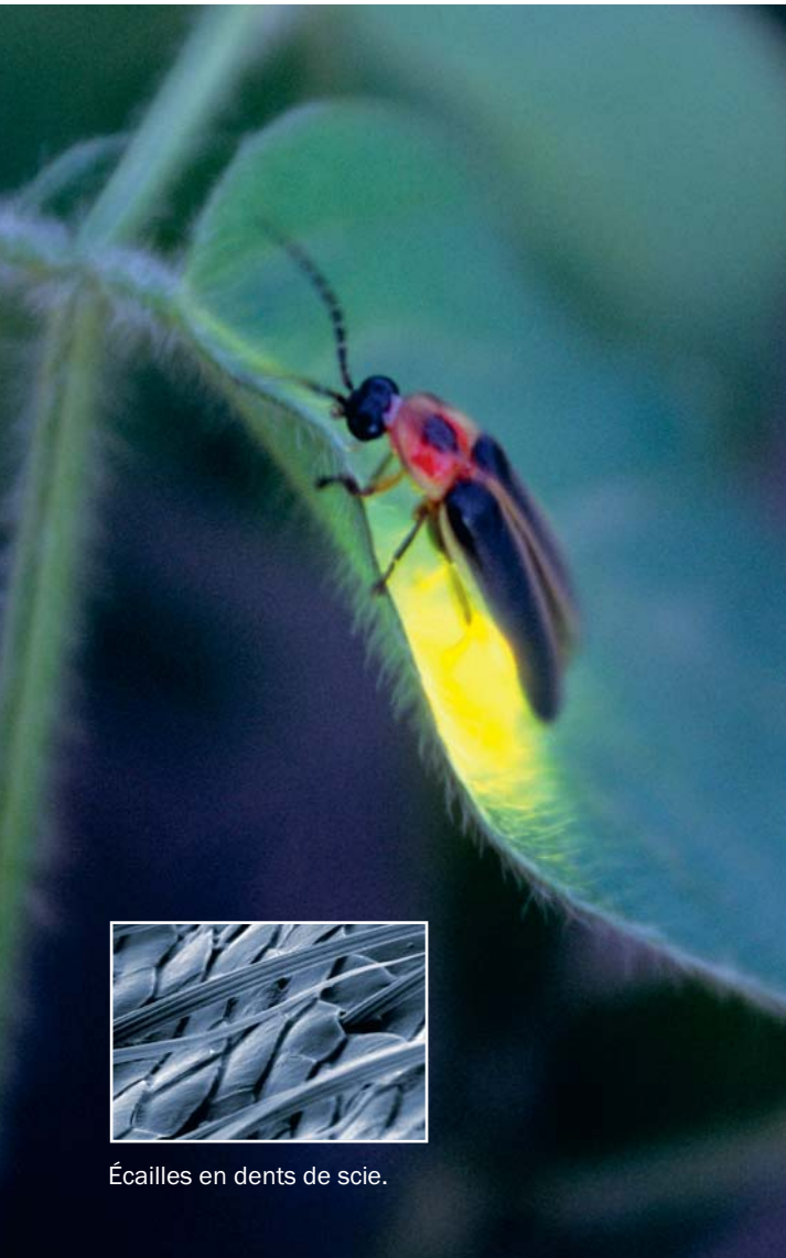
Luciole : Gail Shumway/Photographer's Choice/Getty Images ; écailles : Optics Express