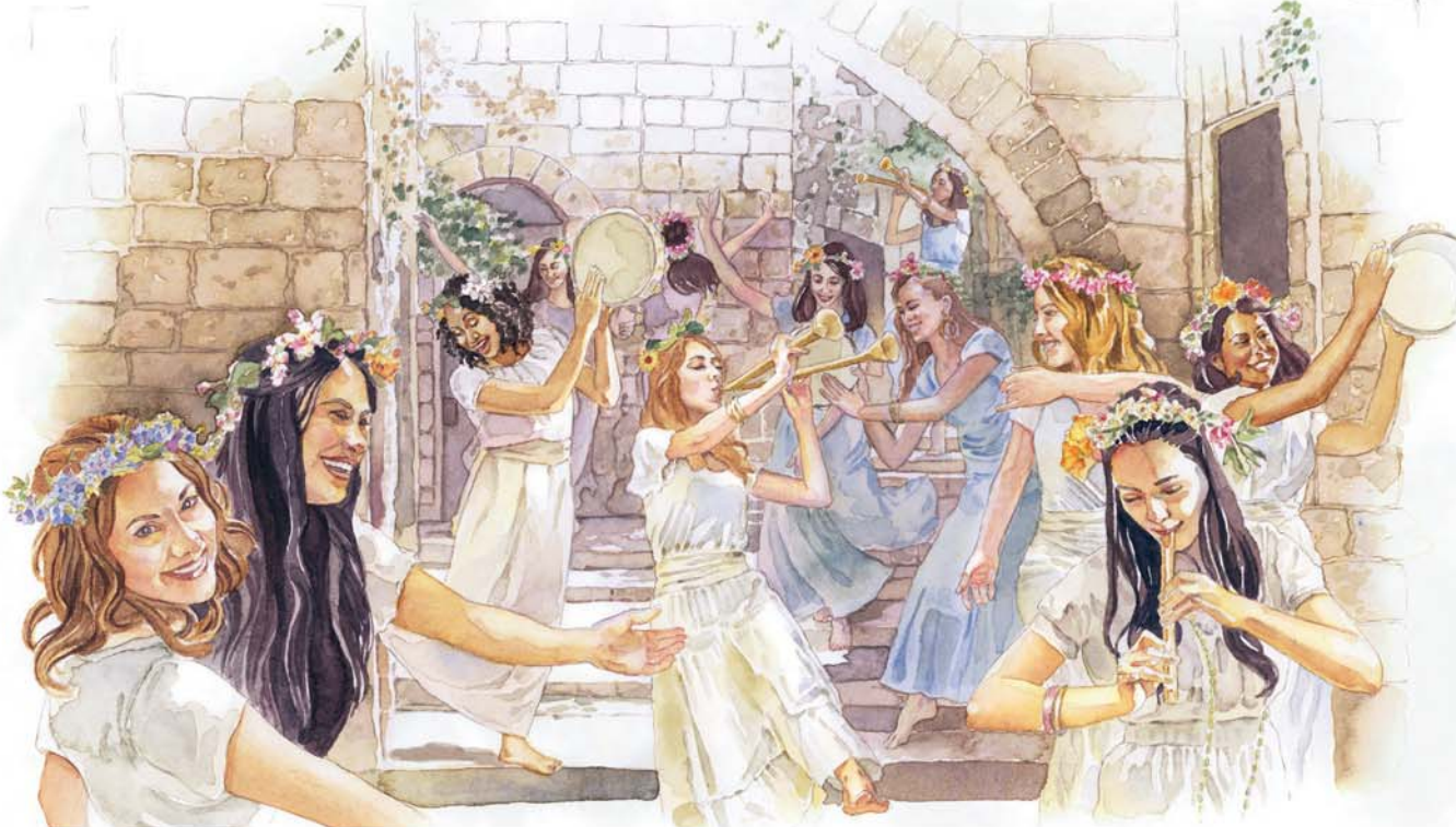
Le mariage de l'Agneau fait la joie des « vierges », « compagnes » de la mariée (voir paragraphe 16).

fois, le mariage de l'Agneau ne fera pas le bonheur que des époux.