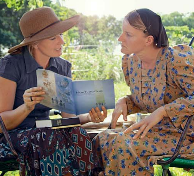
Les publications en bas allemand sont notamment utilisées au Paraguay (voir aussi l'illustration du titre).

participer à cette activité capitale. Cette œuvre internationale de prédication et d'enseignement est une autre caractéristique qui convainc beaucoup de gens que les Témoins de Jéhovah sont les véritables disciples de Christ Jésus.