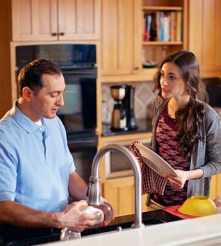
Pour bien CONNAÎTRE vos enfants, écoutez-les (voir paragraphes 3-9).