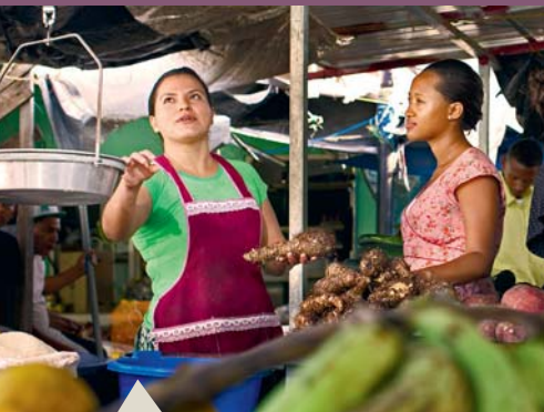
Un marché à Bélize

Le Bélize a créé la première réserve de jaguars dans le monde.