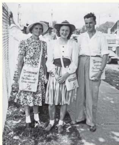
Papa, maman et moi en 1941, à l'assemblée de Saint Louis (Missouri).

Cette prophétie m'a permis de comprendre ce que l'avenir réservait. Il a été annoncé que, l'année suivante, l'École de Guiléad débiterait, ce qui m'a donné envie de devenir missionnaire. En 1943, j'ai été affectée pionnière à Portland,