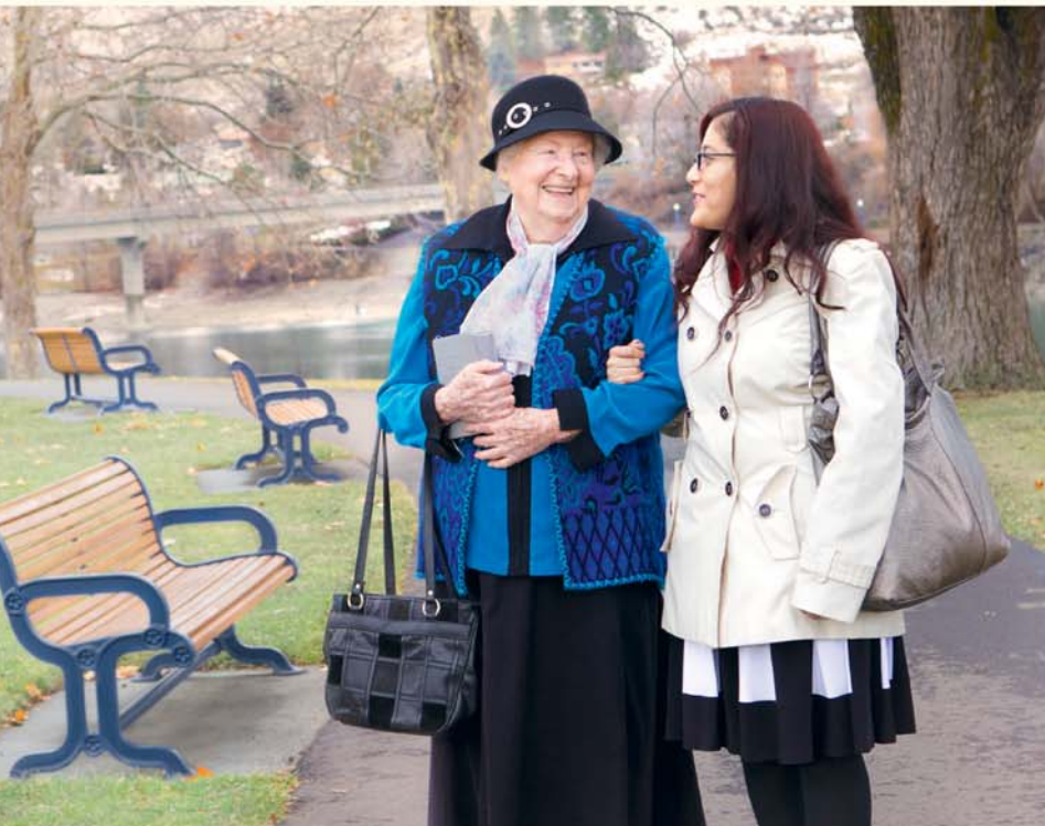
Le service de pionnier m'aide à rester jeune d'esprit.

À 91 ans, je suis plutôt en bonne santé. Alors je suis toujours pionnière. Le service de pionnier m'aide à rester jeune d'esprit et me donne un but dans la vie. Quand je suis arrivée au Salvador, l'œuvre y débutait à peine. Malgré l'opposition tenace de Satan, ce pays compte aujourd'hui plus de 39000 proclamateurs. Cet accroissement a réellement fortifié ma foi. Incontestablement, Jéhovah soutient par son esprit saint les efforts de ses serviteurs !