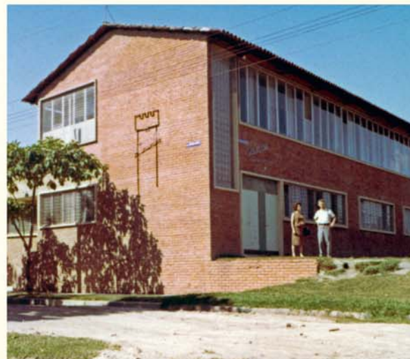
Le Béthel du Salvador construit en 1955.

J'ai été missionnaire au Salvador pendant près de 29 ans. D'abord à Santa Ana, puis à Sonsonate, ensuite à Santa Tecla et enfin à San Salvador.