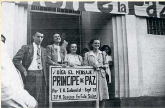
La première assemblée de circonscription à laquelle nous avons assisté au Salvador.