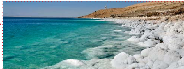
Mer Morte