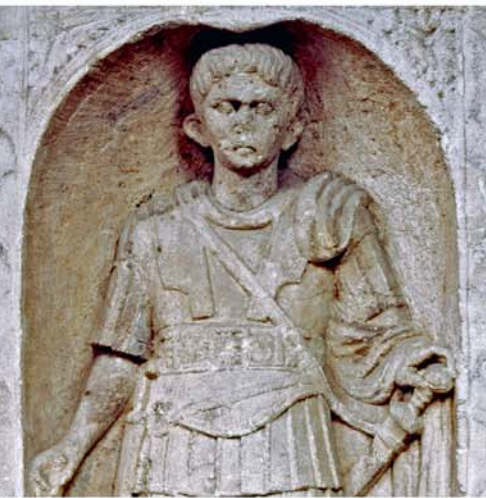
STÈLE DU CENTURION MARCUS FAVONIUS FACILIS

Les Écritures grecques chrétiennes parlent à plusieurs reprises de centurions romains. L'officier qui a surveillé l'exécution de Jésus avait ce grade, de même que Corneille, le premier Gentil à s'être converti au christianisme. L'officier qui devait surveiller la flagellation de l'apôtre Paul et Julius, qui a escorté celui-ci jusqu'à Rome, étaient eux aussi centurions (Marc 15:39 ; Actes 10:1, note ; 22:25 ; 27:1).