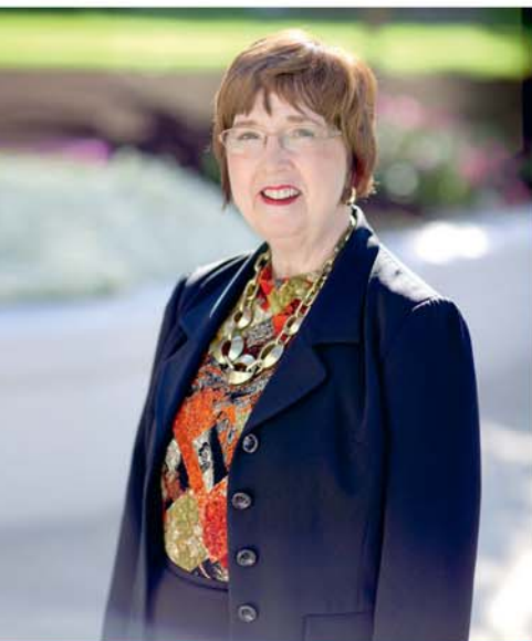
PAR DORIS ELDRED