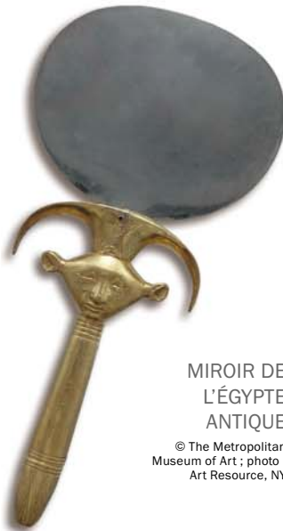
MIROIR DE L'ÉGYPTE ANTIQUE

Contrairement aux miroirs actuels, ceux des temps bibliques étaient en général fabriqués en métal finement poli — bronze, mais aussi parfois cuivre, argent, or ou électrum. La première fois que la Bible parle de miroirs, c'est en rapport avec la construction du tabernacle, premier lieu de culte de la nation d'Israël. Des miroirs ont été offerts par des femmes pour la fabrication d'un bassin sacré en cuivre et de son support (Exode 38:8). À cette fin, il a probablement fallu les fondre.