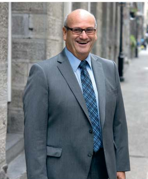
PAR NORMAND PELLETIER