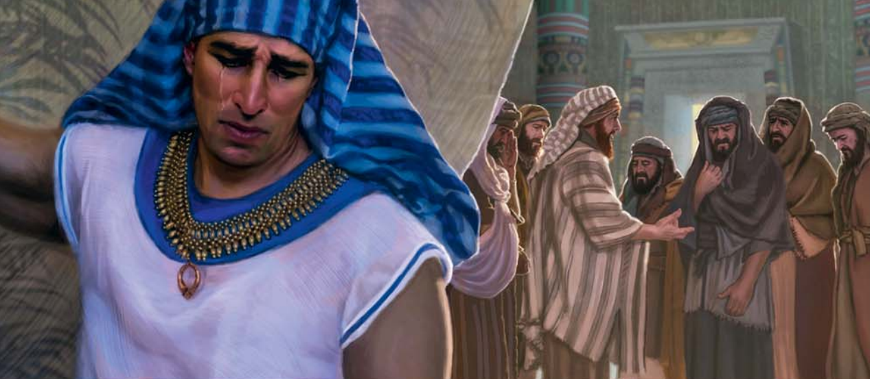
Joseph a vu que ses frères regrettaient ce qu'ils lui avaient fait.

père ? » (Genèse 44:18-34). C'est maintenant évident : il n'est plus le même homme. Il manifeste un état d'esprit repentant, mais aussi une empathie, un désintéressement et une compassion admirables.