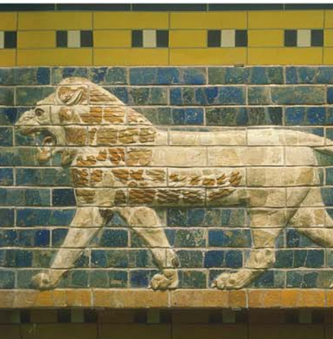
FRISE EN BRIQUES ÉMAILLÉES DATANT DE LA BABYLONE ANTIQUE.

Photographie prise avec l'aimable autorisation du British Museum