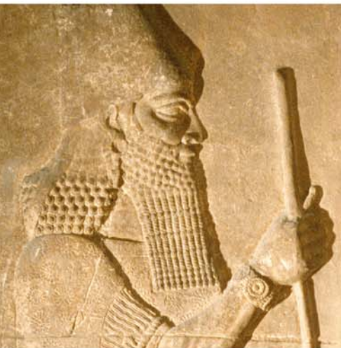
LE ROI ASSYRIEN SARGON II, MENTIONNÉ EN ISAÏE 20:1.