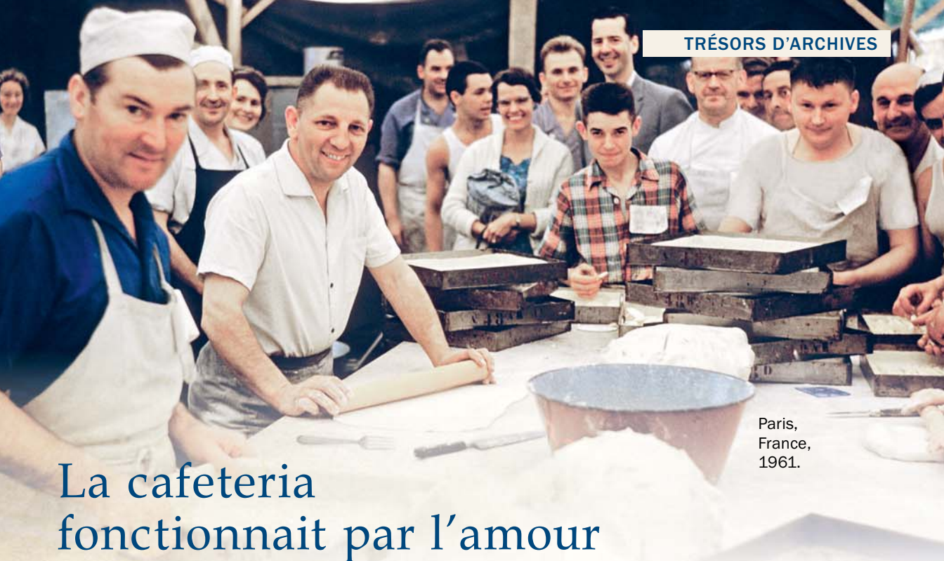
Paris, France, 1961.