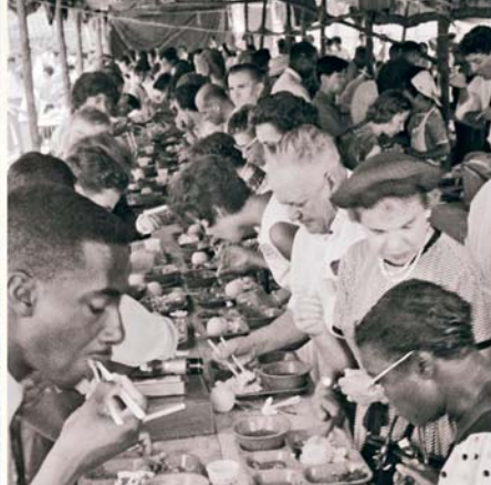
Séoul, Corée, 1963.