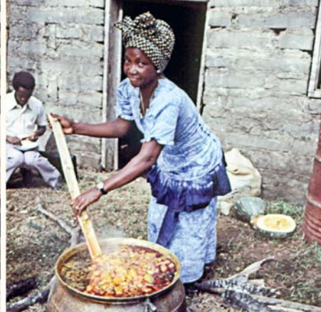
Sierra Leone, 1982.

en vapeur une quarantaine de marmites. Les serveurs ont distribué 30 000 repas par heure. Pour épargner du travail aux 576 plongeurs, les assistants avaient amené leur fourchette et leur couteau. À Rangoun (Birmanie), les cuisiniers, pleins d'égards, ont eu la main moins lourde sur le piment en préparant les repas destinés aux délégués étrangers.