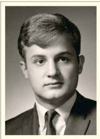
Jeune, j'ai eu quelques contacts avec la vérité.