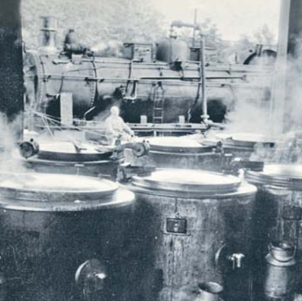
Francfort, Allemagne, 1951.