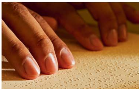
Un aveugle lisant la revue La Tour de Garde en braille.

Il est vrai que les aveugles rencontrent des difficultés particulières. Mais quand quelqu'un fait face à de telles difficultés et va de l'avant en gardant sa joie de vivre, quel puissant hommage à la capacité de l'homme à s'adapter et à surmonter les épreuves de la vie ! ■