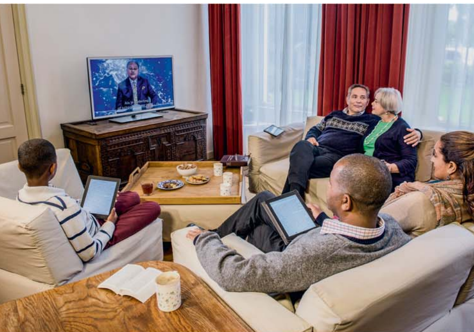
Le culte familial renforce les liens entre jeunes et moins jeunes (voir paragraphes 12, 15).

tu peux dire ou faire pour fortifier ton union. Les couples mariés depuis longtemps peuvent même aider les membres plus jeunes de la congrégation à cet égard. De temps en temps, ton conjoint et toi pourriez inviter un couple plus jeune à se joindre à votre culte familial. En vous observant, les plus jeunes verront que l'affection et l'harmonie sont importantes même quand on est marié depuis longtemps (Tite 2:3-7).