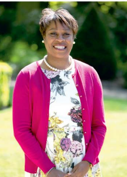
PAR YVONNE QUARRIE