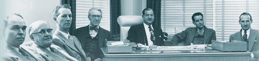
Le collège central, dans les années 50.