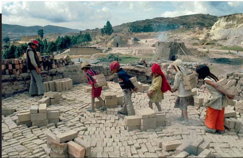
Des millions de personnes subissent encore l'esclavage.

des esclaves en abondance ; et la demande d'esclaves a parfois mené à la guerre. On estime qu'au 1 er siècle, les esclaves représentaient près de la moitié de la population de Rome. Beaucoup d'esclaves égyptiens et romains étaient durement exploités. L'espérance de vie des esclaves travaillant dans les mines romaines, par exemple, n'était que d'une trentaine d'années.