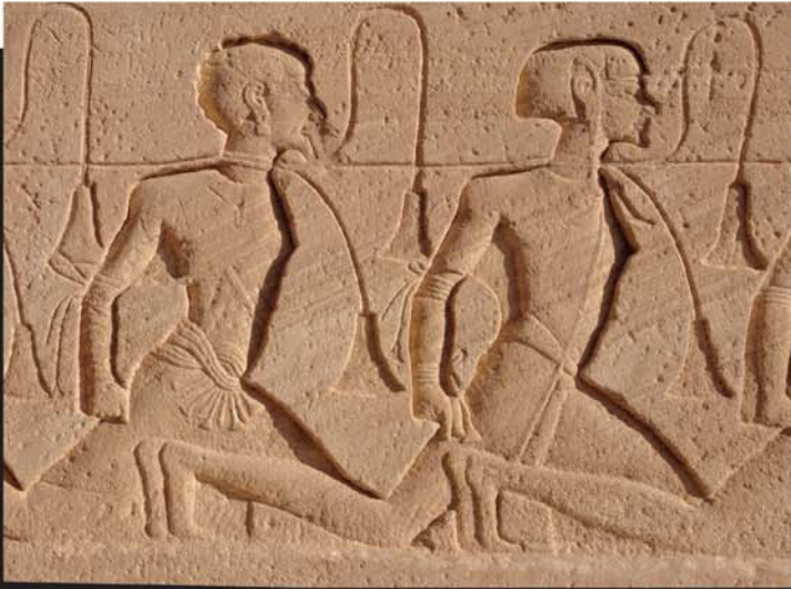
Représentation d'esclaves en captivité dans l'Égypte antique.