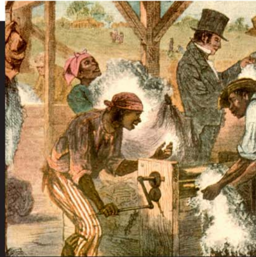
La traite des esclaves entre l'Afrique et les Amériques était très lucrative.