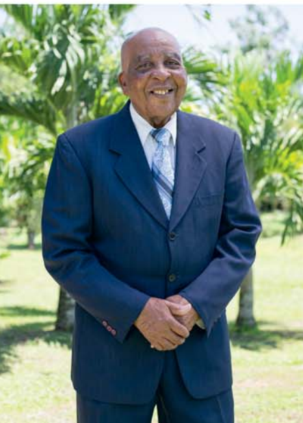
PAR SAMUEL HAMILTON