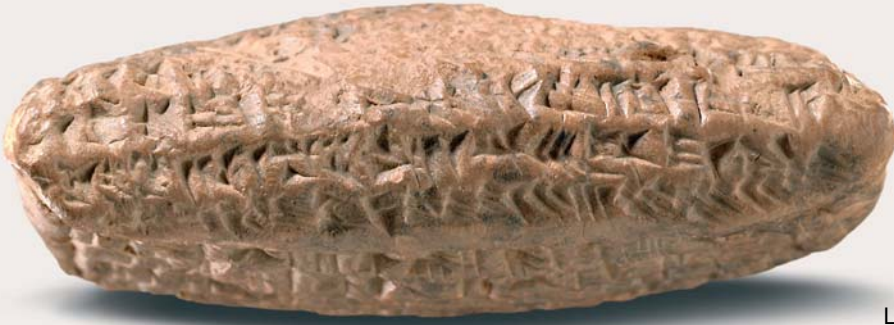
Le nom « Tattannu » figure sur cette tablette cunéiforme.