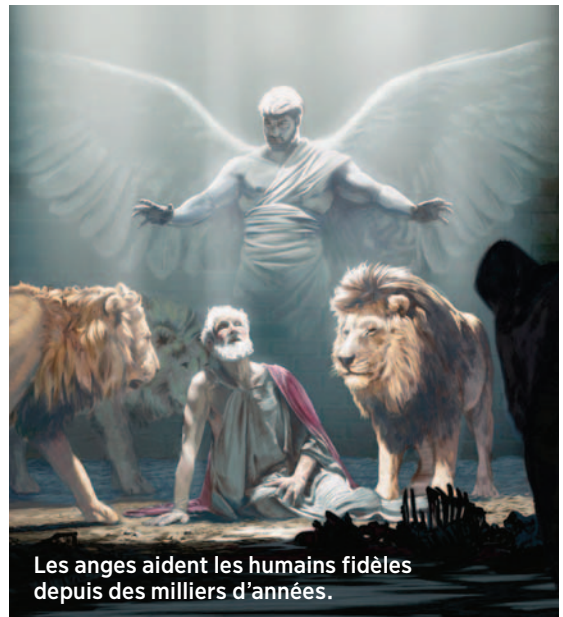
Les anges aident les humains fidèles depuis des milliers d'années.