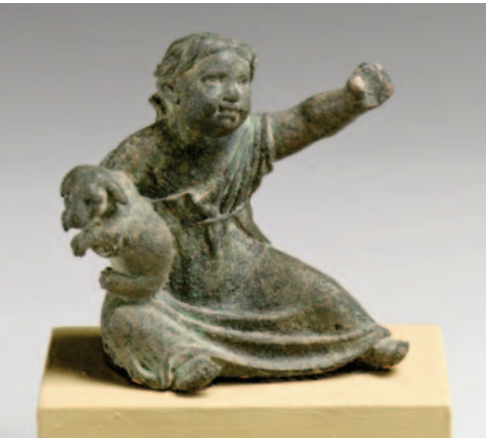
Un enfant avec un chiot, statuette grecque ou romaine (entre le I er siècle avant notre ère et le II e siècle de notre ère).