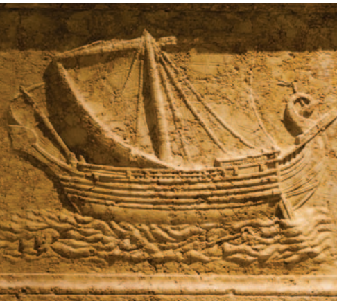
Un bas-relief représentant un grand navire (I er siècle de notre ère).

Absolument pas. Ce que Jésus voulait dire, comme il l'a expliqué à ses disciples, c'était qu'à ce moment-là sa priorité était d'aider les Juifs. C'est ce qu'il a fait comprendre à cette femme à l'aide d'un exemple : « Ce n'est pas bien de prendre le pain des enfants et de le jeter aux petits chiens » (Matthieu 15:21-26 ; Marc 7:26). Chez les Grecs et les Romains, les chiens étaient en général des animaux de compagnie qui vivaient dans la maison de leur maître et jouaient avec les enfants. Ainsi, l'expression « petits chiens » a dû évoquer chez la femme grecque une image touchante. Elle a repris les paroles de Jésus et a répondu : « Oui, Seigneur ; et pourtant les petits chiens mangent bien des miettes qui tombent de la table de leurs maîtres. » Jésus l'a félicitée pour sa foi et a guéri sa fille (Matthieu 15:27, 28). ■