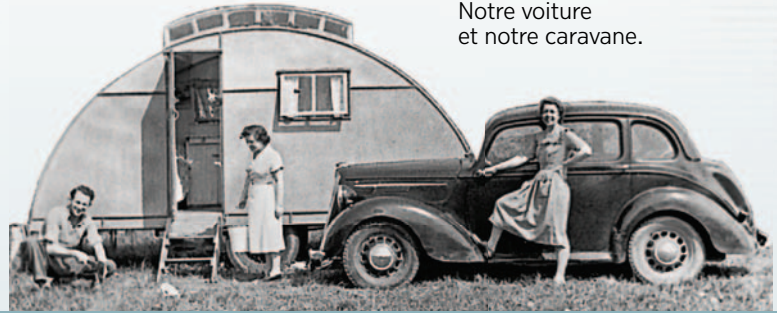
Notre voiture et notre caravane.

dispensées des activités militaires. Mais les tribunaux m'ont condamnée à 31 jours de prison. L'année suivante, quand j'ai eu 19 ans, je me suis fait inscrire comme objectrice de conscience, c'est-à-dire quelqu'un qui ne veut pas faire la guerre parce que sa conscience le lui interdit. J'ai dû passer devant deux autres tribunaux, mais je n'ai pas été condamnée. Du début à la fin de cette épreuve, j'ai senti que l'esprit saint me soutenait, que Jéhovah me tenait la main, et qu'il me rendait forte (Is. 41:10, 13).