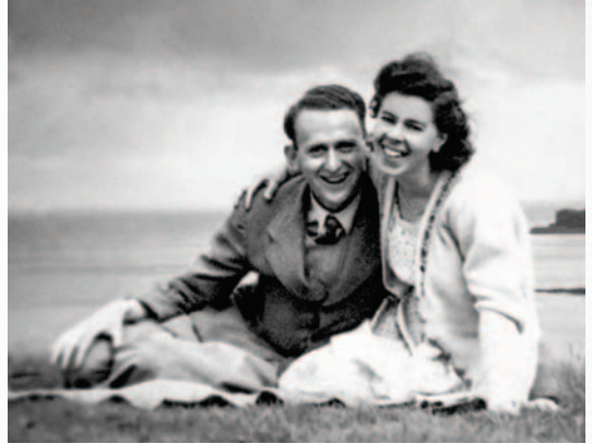
À Hemsworth, peu après notre mariage (1949).

« On veut bien faire ça ! » C'est ce que mon mari et moi, avec mon frère et sa femme, avons répondu quand on nous a proposé une mission. Pourquoi avons-nous accepté, et comment Jéhovah nous a-t-il bénis ? Avant de répondre, je vais vous raconter d'où je viens.