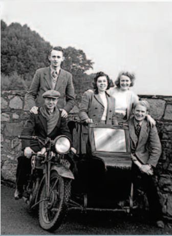
Nous et d'autres pionniers sur la moto et le side-car.