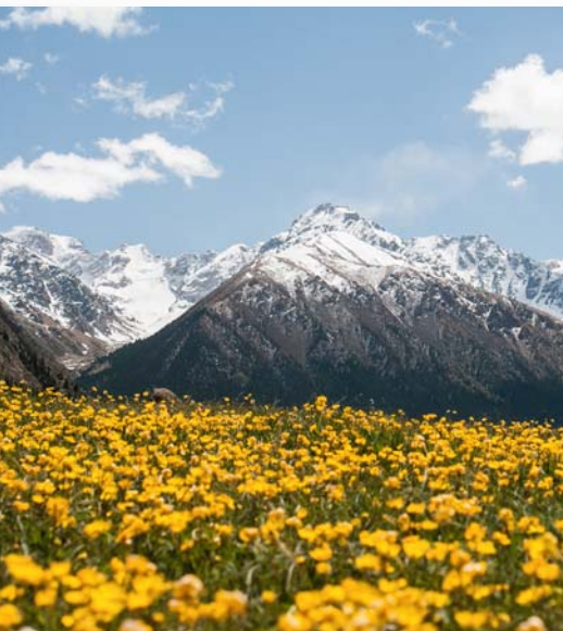
Les montagnes Teskey Ala-too.

Jéhovah a aussi transformé ma vie. J'ai grandi dans une famille modeste d'ouvriers agricoles et je n'ai été à l'école que cinq ans. Pourtant, il m'a utilisé pour servir comme ancien et pour enseigner la Bible à des personnes qui avaient plus d'instruction que moi. C'est certain, Jéhovah réalise des choses extraordinaires ! Ce que j'ai vécu me pousse à continuer de témoigner fidèlement au sujet de Jéhovah, avec qui « tout est possible » (Mat. 19:26).