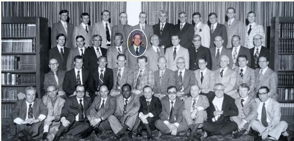
En 1977, j'ai assisté à une réunion pour les itinérants à Toronto, au Canada.

Plus tard dans l'année, une des assemblées internationales « La foi victorieuse » s'est tenue dans le stade olympique de Montréal.