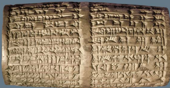
Cylindre d'argile contenant le nom Balthazar (taille réelle).