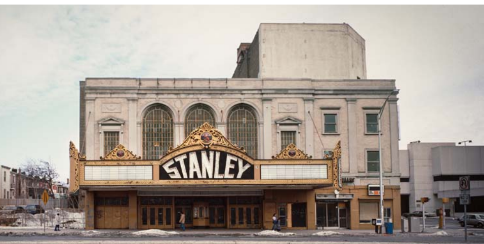
Le théâtre Stanley quand nous l'avons acheté.

Durant ma première semaine au Béthel, nous avons déposé une plainte auprès du tribunal fédéral de première instance pour