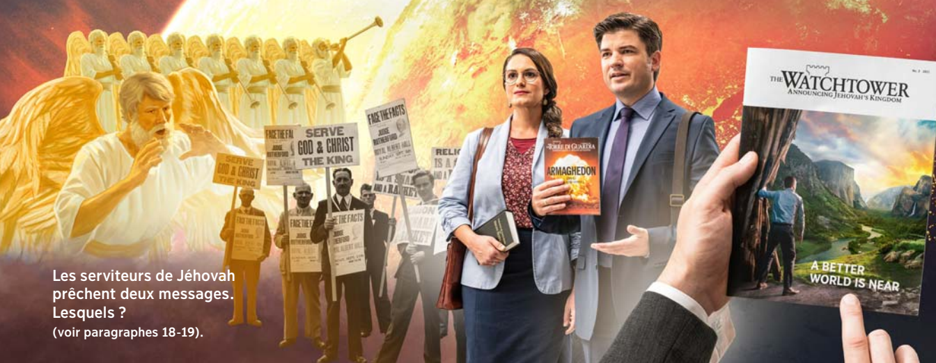
Les serviteurs de Jéhovah prêchent deux messages. Lesquels ? (voir paragraphes 18-19).

15 Satan a lancé une attaque contre les huit frères oints qui dirigeaient l'activité de prédication. Ces frères qui exerçaient des responsabilités importantes étaient les « deux témoins » qui, d'après la Révélation, seraient tués* (Rév. 11:3, 7-11). En 1918, ils ont été accusés faussement et condamnés à de longues peines de prison. C'était comme si l'activité de ces chrétiens oints avait été « tuée ».