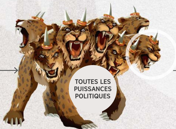
TOUTES LES PUISSANCES POLITIQUES