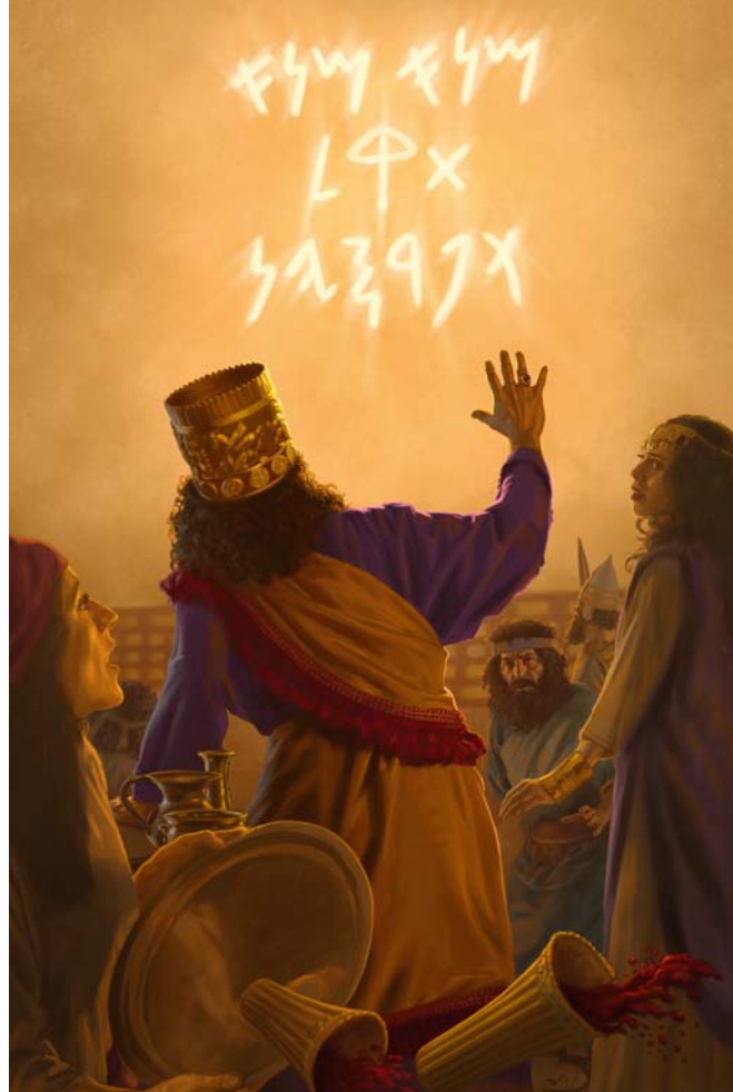
Jéhovah a enlevé à Balthazar son royaume et l'a donné aux Mèdes et aux Perses (voir paragraphe 12).

12. Cite un cas où Jéhovah a enlevé à un roi son pouvoir (voir illustration).