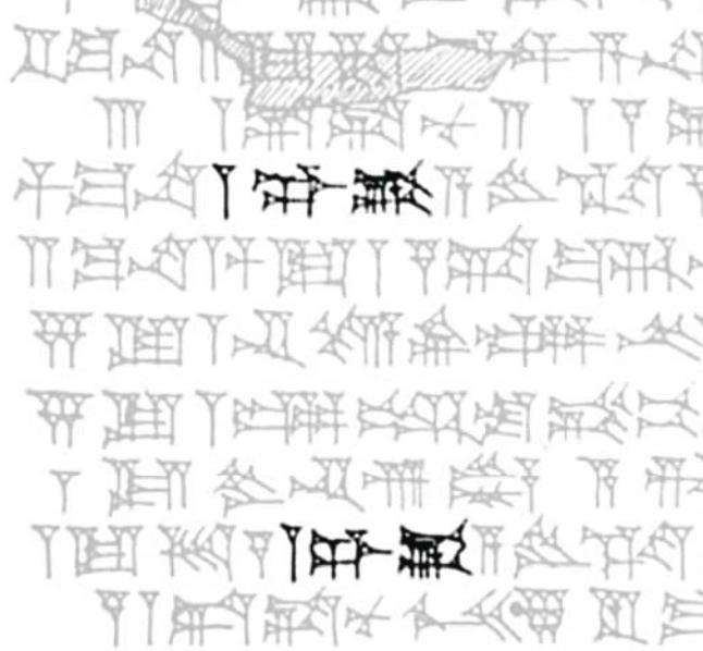
Le nom « Mardochée » ( Marduka ) tel qu'il figure dans un texte en écriture cunéiforme perse.

Depuis, des experts ont traduit des milliers d'autres textes cunéiformes perses. Parmi ces textes, il y a les tablettes de Persépolis, qui ont été découvertes dans les ruines du Trésor, près des murailles de la ville. Ces tablettes datent du règne de Xerxès I er . Elles sont écrites en langue