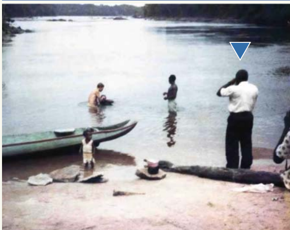
J'assiste à un baptême dans la rivière Tapanahoni, près de Godo Holo (dans l'est du Suriname), en 1983.

produit l'évènement raconté en introduction. Après être resté quelques instants sous l'eau, notre bateau est remonté à la surface. Nous portions des gilets de sauvetage et, heureusement, aucun de nous n'est tombé du bateau. Par contre, il était rempli d'eau. Nous avons alors vidé le contenu de nos gamelles dans la rivière et les avons utilisées pour écoper le bateau.