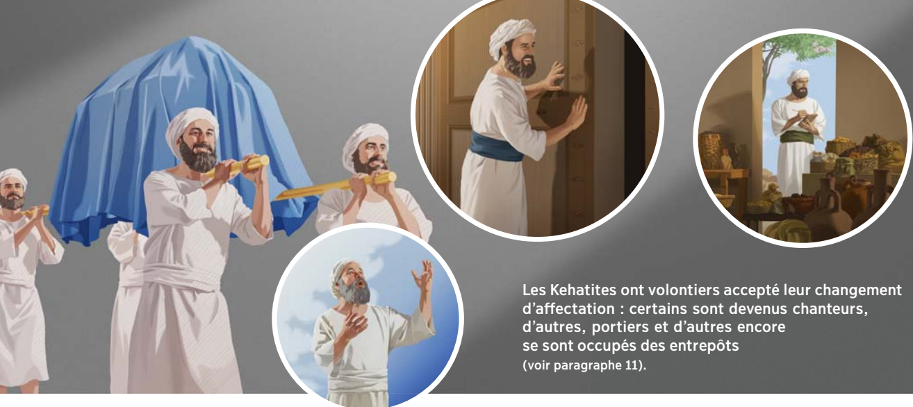
Les Kehatites ont volontiers accepté leur changement d'affectation : certains sont devenus chanteurs, d'autres, portiers et d'autres encore se sont occupés des entrepôts (voir paragraphe 11).

la tâche qu'on te donne, trouves-y de la joie. Rappelle-toi que ce n'est pas une tâche ou une affectation qui fait ta valeur. C'est avant tout à ton obéissance que Jéhovah accorde du prix (1 Sam. 15:22).