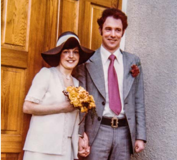
Le jour de notre mariage, en mars 1977.

politiques et religieux étaient intimement liés. Mais tant les protestants que les catholiques se rendaient bien compte que les Témoins sont politiquement neutres. Nous pouvions donc prêcher librement et en toute sécurité. Souvent, nos interlocuteurs savaient où et quand allaient avoir lieu des affrontements violents. Alors ils nous prévenaient pour que nous évitions ces zones.